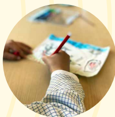
Taller 'Pequeños Genios'