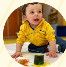
Taller de Expresión Plástica 'ART'