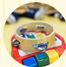
Taller 'Fun English'