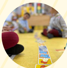
Taller de Inteligencia Emocional (4-5 años)