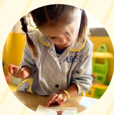
Taller de Expresión Oral (3 años)