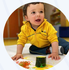
Taller de Expresión Plástica 'ART'