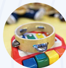
Taller 'Fun English'