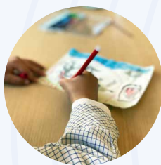
Taller 'Pequeños Genios'