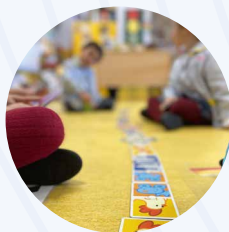
Taller de Inteligencia Emocional (4-5 años)